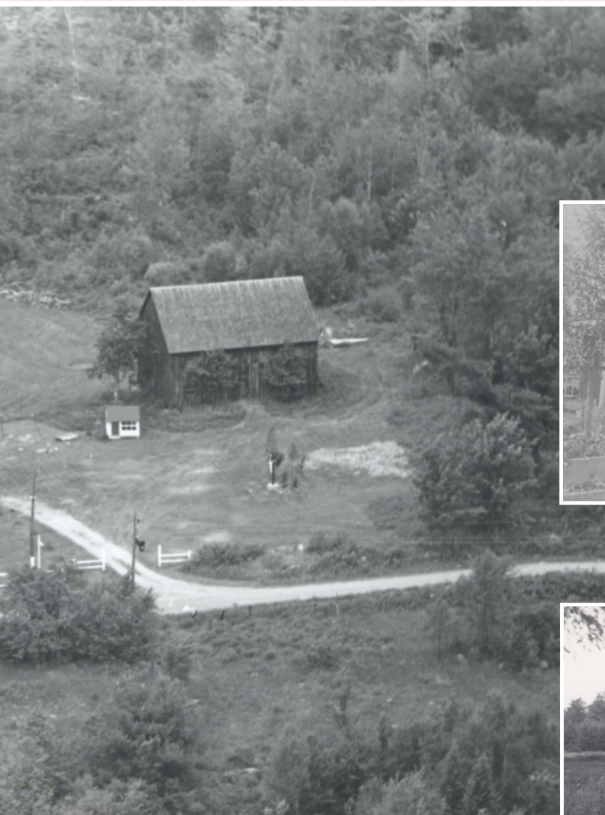
La maison Gaffney-Kennedy est inscrite sur un site patrimonial qui témoigne de l'histoire agricole du secteur avec sa dépendance. Son caractère champêtre participe à l'identité de Saint-Colomban.

“À son apogée, on compte environ 250 familles à Saint-Colomban sur un sol finalement difficile à cultiver.”