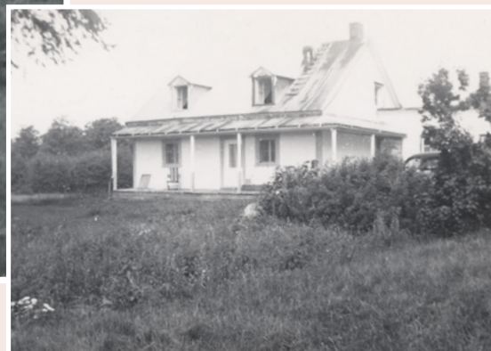
L'ajout de lucarnes va permettre d'agrandir la maison par le grenier en laissant passer la lumière.