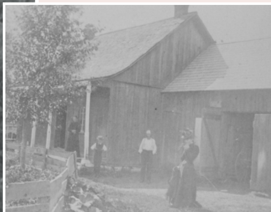
Les ouvertures sont ponctuées de fenêtres à petits carreaux, un modèle très ancien encore en vogue au début du XIXe siècle.

Source : BANQ, Collection Point du Jour Aviation, 1964.